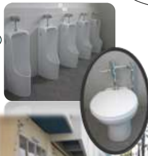
工事中の外トイレ

長年の懸案であったトイレのにおいや、洋式トイレの詰まり、手洗い場の改善のために改修工事が行われています。今回は、主に男子トイレを中心に配管や便器が改善されます。校内は、冬休み中に完了しましたが、外トイレの改修は2月の半ばまでかかります。子どもたちにとって、きっと使い勝手の良い環境になると思います。少しの間不便をかけますが、よろしくお願い致します。